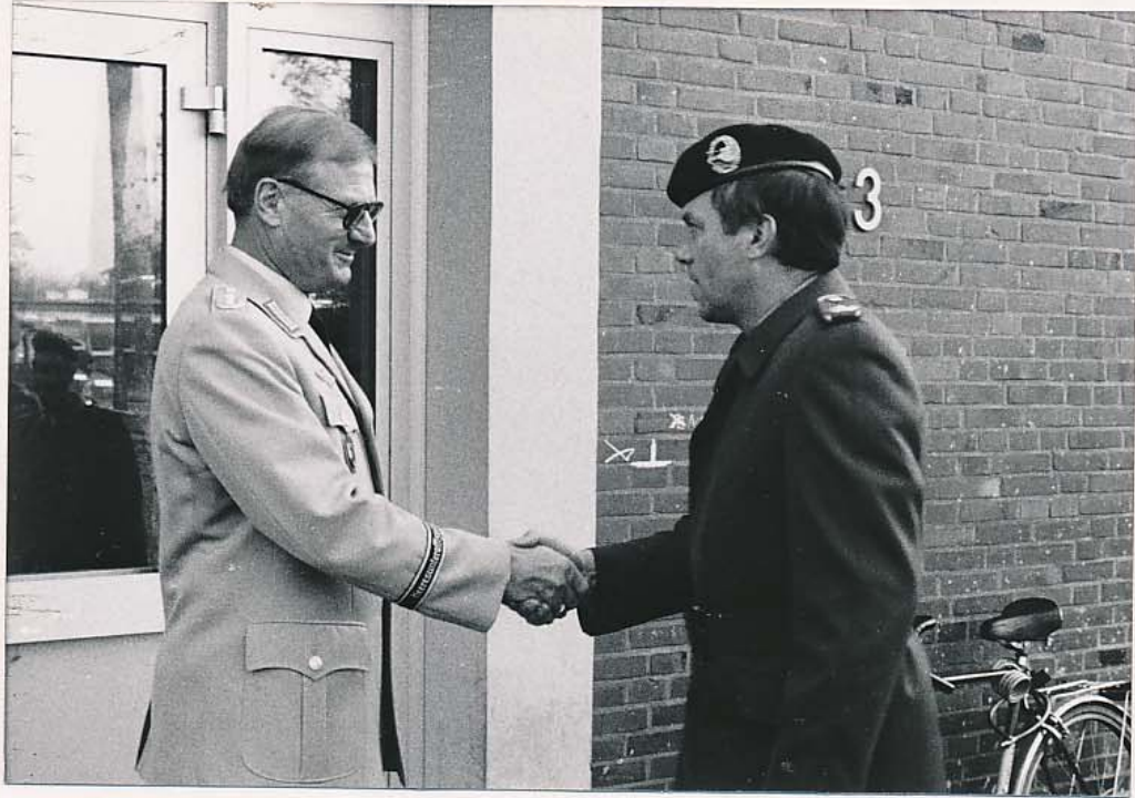
mit Offizieren des Korpsstabes