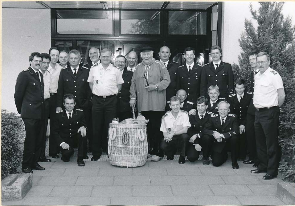
4400 Münster, 07. Mai 1993