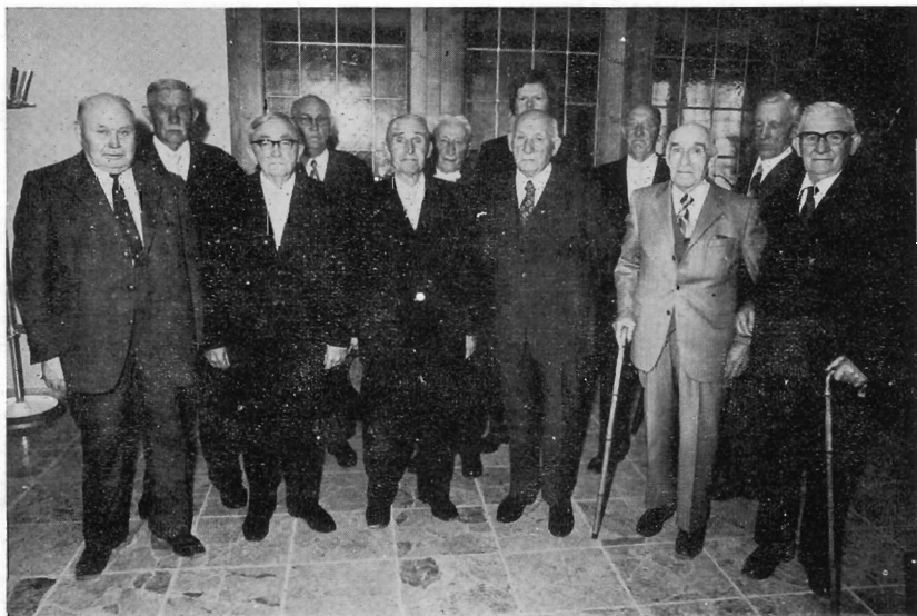
Jubilare und Teilnehmer des 1. Weltkrieges mit dem 1. Vorsitzenden