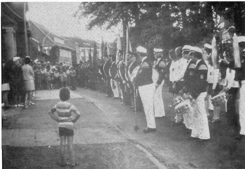
Gefallenenehring 1973 am Ehrenmal